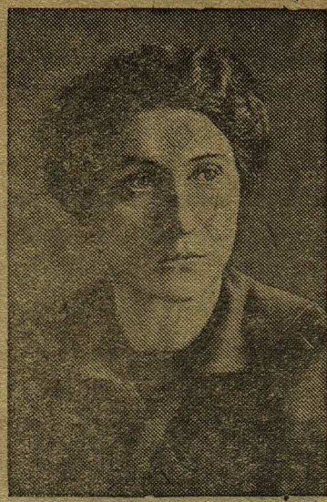
Выдающаяся советская писательница, автор замечательных книг о жизни и борьбе польского народа, депутат Верховного Совета СССР Ванда Василевская.

Так как в городе существовала некоторая промышленность, то он находился под особым наблюдением и опекой полиции, жандармерии и всяких охранных отрядов. За каждым рабочим, подозревав